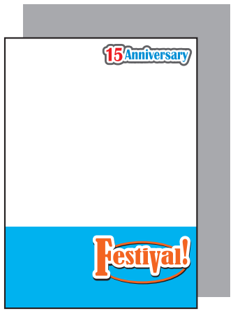
全面白版の場合 (全体に背景が透けにくくなります。)

クリアファイルの素材は透明なので、透けさせたくない部分と 白色で表現したい部分は、K100%（黒）で白版を制作してください。