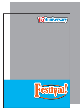
上の文字と下部のみ白版の場合 (白版を引いた部分以外は透けます。)