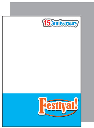
全面白版の場合 (全体に背景が透けにくくなります。)

クリアファイルの素材は透明なので、透けさせたくない部分と 白色で表現したい部分は、K100% (黒) で白版を制作してください。