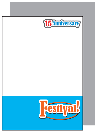
全面白版の場合 (全体に背景が透けにくくなります。)

クリアファイルの素材は透明なので、透けさせたくない部分と 白色で表現したい部分は、K100% (黒) で白版を制作してください。